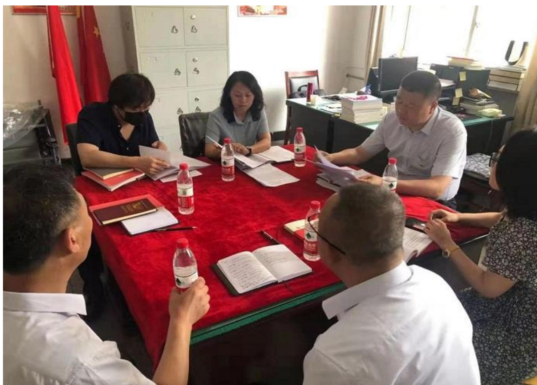
学院纪委深入基层抽查学习进展进行专项指导监督

学院各级党组织严格按照时间节点开展工作，充分发扬马克思主义优良学风，通过召开专题学习、专题党课、专题研讨、专题培训、主题党日等活动，综合运用线下与线上相结合的方式，共计开展专题学习 38 次，讲专题党课 74 次，开展专题培训 5 次，专题组织生活会 17 次，开展集体学习研讨 200 余次，形成了学习热潮。学院党史学习教育领导小组办公室协同学院纪委紧跟党史学习教育安排，抓关键、抓节点、抓效果，在各阶段深入基层抽查学习进展，将专项指导监督作用落在经常、落在过程之中。院工会积极组织全院 648 名教职工参加全省党史知识竞赛，成绩突出，实现参与覆盖率达 90% 以上，在省教科文卫体系统 170 多家单位中荣获“优秀组织奖”。